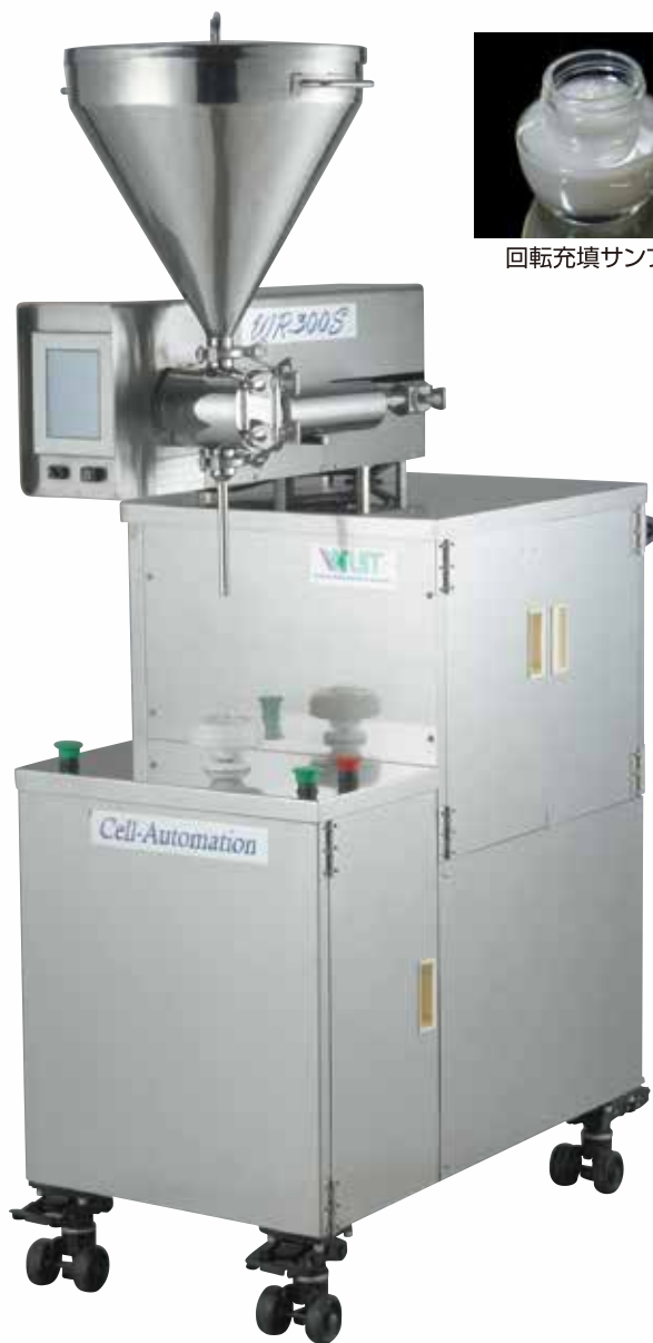
回転充填サンプル