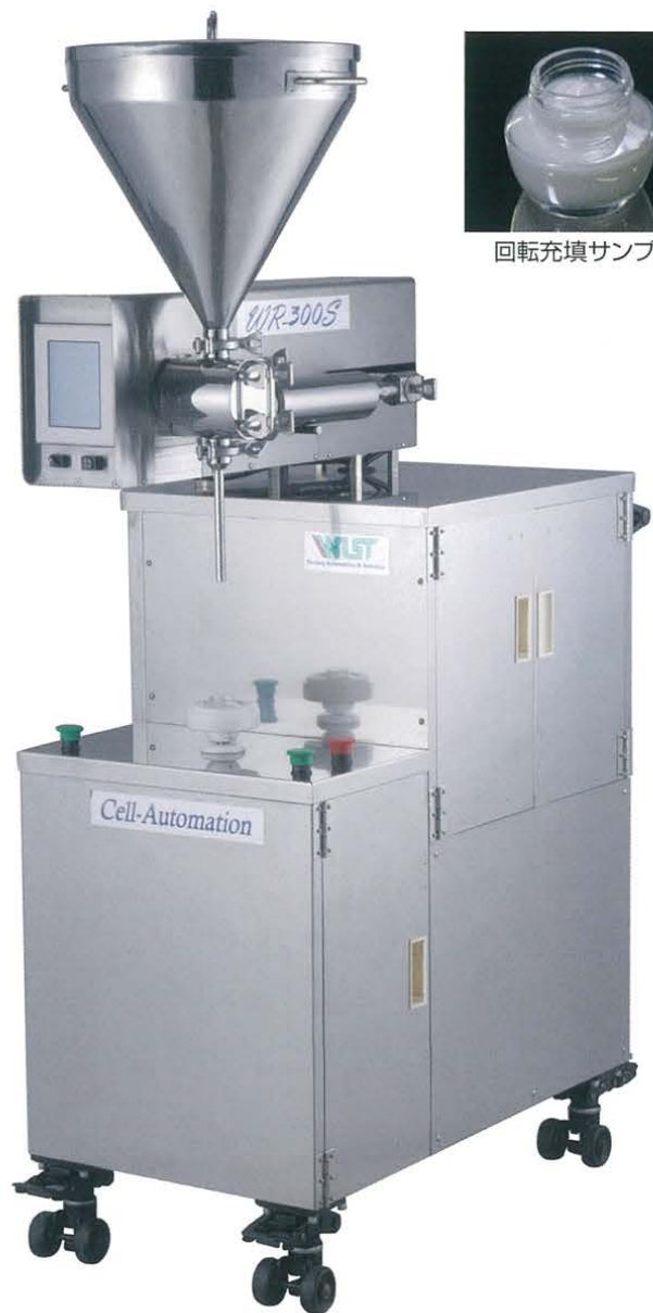
回転充填サンプル